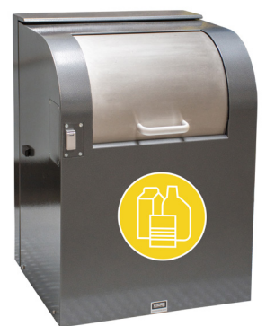
Einwurf für Leichtverpackungen