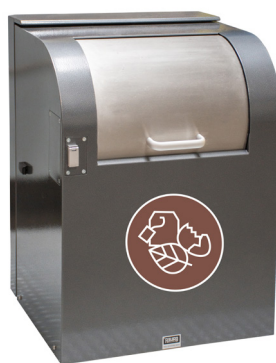
Einwurf für Bioabfälle