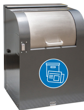
Einwurf für Papier