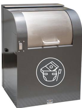
Einwurf für Restabfälle