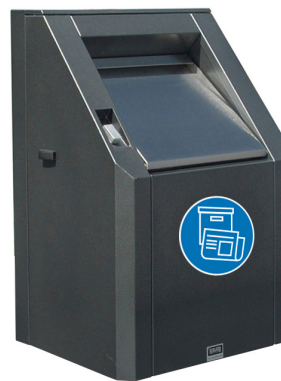
Einwurf für Papier