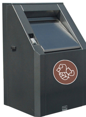
Einwurf für Bioabfälle