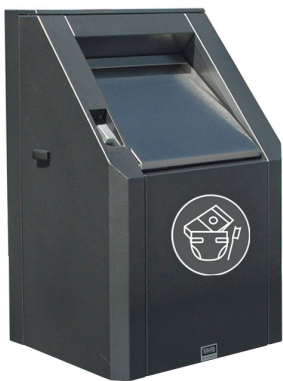
Einwurf für Restabfälle