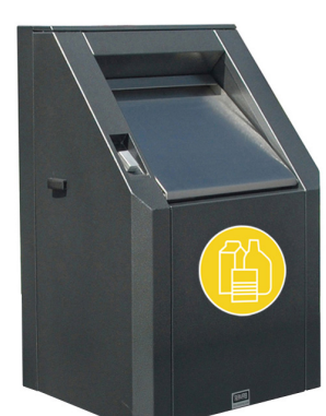
Einwurf für Leichtverpackungen