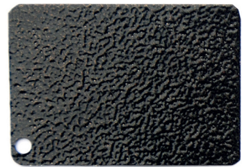
Antik Schwarz Bronze